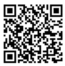
キャンパスマップ