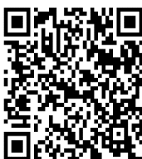
バスの時間表 (岡山駅発着)